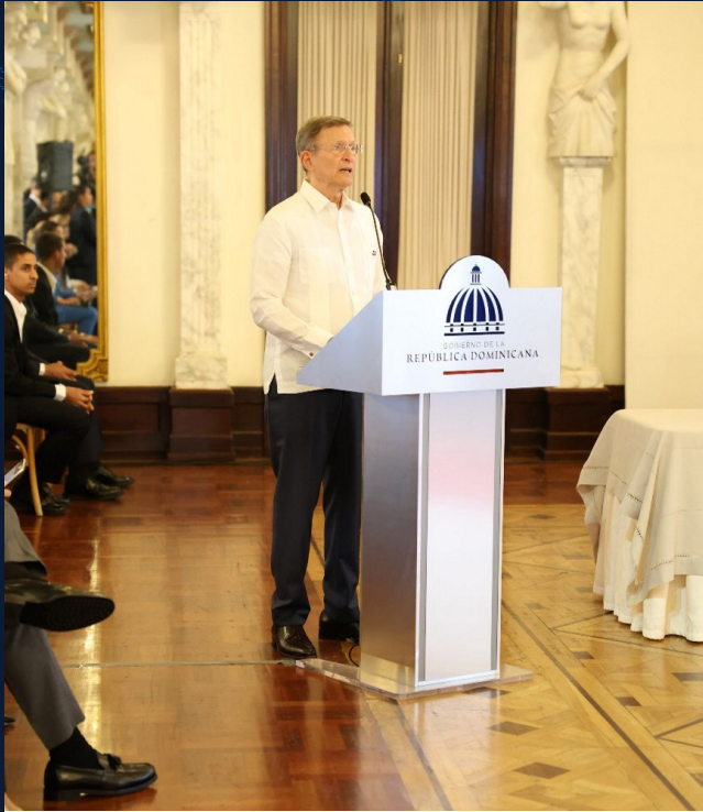
El canciller, Roberto Álvarez anunció “la incorporación de República Dominicana al programa Global Entry

reconocimiento al fortalecimiento y solidez de nuestras instituciones democráticas, del Estado de derecho, del crecimiento y estabilidad de la economía, de la lucha contra la corrupción y la impunidad, de la imagen y prestigio regional del país y de la defensa de los derechos humanos. Todos, ingentes logros alcanzados bajo su liderazgo”.