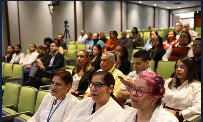
Parte de los asistentes al taller “Hablemos de violencia”.