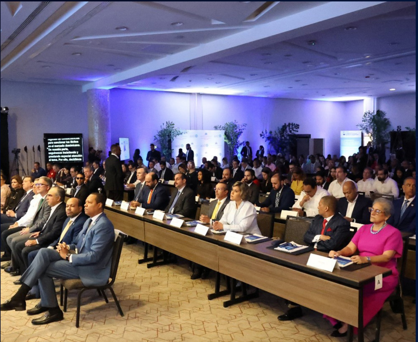
Una parte de la excelente asistencia que tuvo el taller “Comercio Ilícito: Retos para la Salud Pública y las Finanzas en República Dominicana”.

“Combatir el comercio ilícito es algo más que detener el tráfico de drogas ilegales. Se trata de garantizar la seguridad y eficacia de los productos que utilizan nuestros ciudadanos cada día, detener el lavado de activos y la trata de seres humanos y de empoderar a los empresarios que respetan la ley y de reforzar los ingresos fiscales”, expresó Parnell.