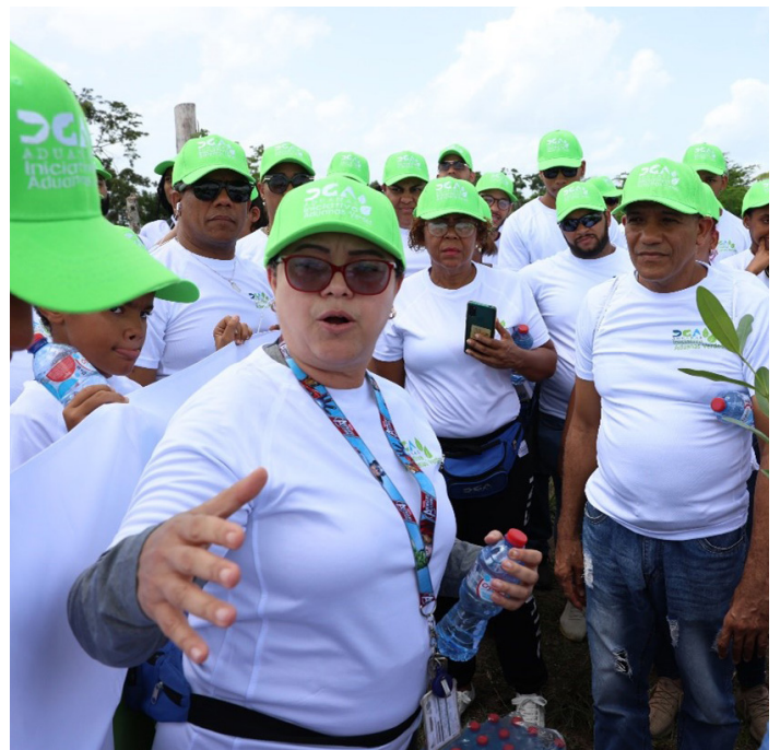
Los colaboradores de Aduanas estuvieron entusiastas en la reforestación.

Los resultados de la jornada de reforestación hablan por sí mismos, pues no solo se contribuyó al medioambiente, al plantar árboles y cuidar el planeta, sino que, también, se fortalecen los lazos de compromisos como equipo. Esta experiencia no solo fue enriquecedora a nivel personal, sino que, también, impactará de manera positiva en nuestra comunidad y en las generaciones futuras.