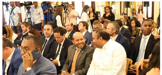
Un ambiente de camaradería entre amigos y funcionarios fue anunciado el programa Global Entry.