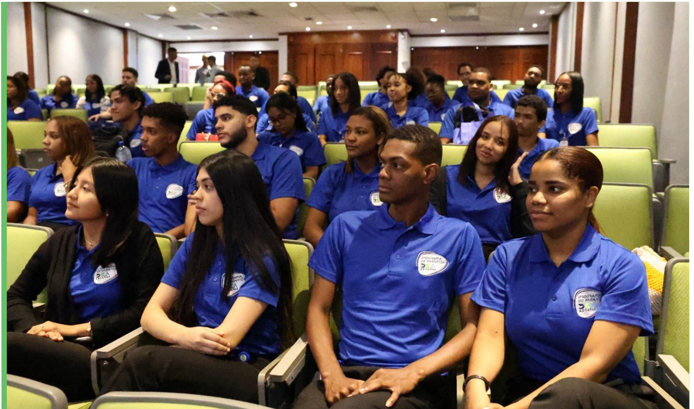
Los nuevos pasantes atentos a las explicaciones de lo que deben hacer en esta nueva temporada.