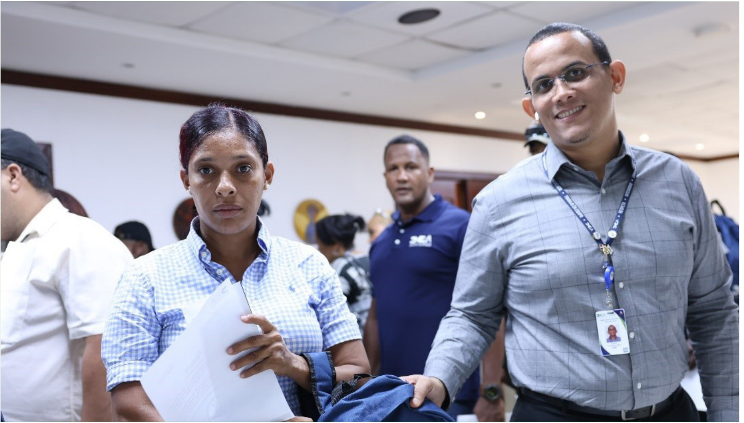
DGA inicia programa de bachillerato para colaboradores de la dirección General de Aduanas.