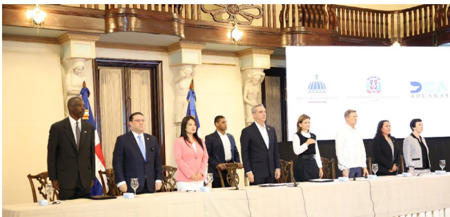
El presidente de la Republica Luis Abinader, la vicepresidenta de la Republica Raquel Peña y otros funcionarios encabezaron el acto de anuncio del programa Global Entry.

El quiosco emite al viajero un recibo de la transacción y dirige al viajero hacia el reclamo de equipaje y la salida.