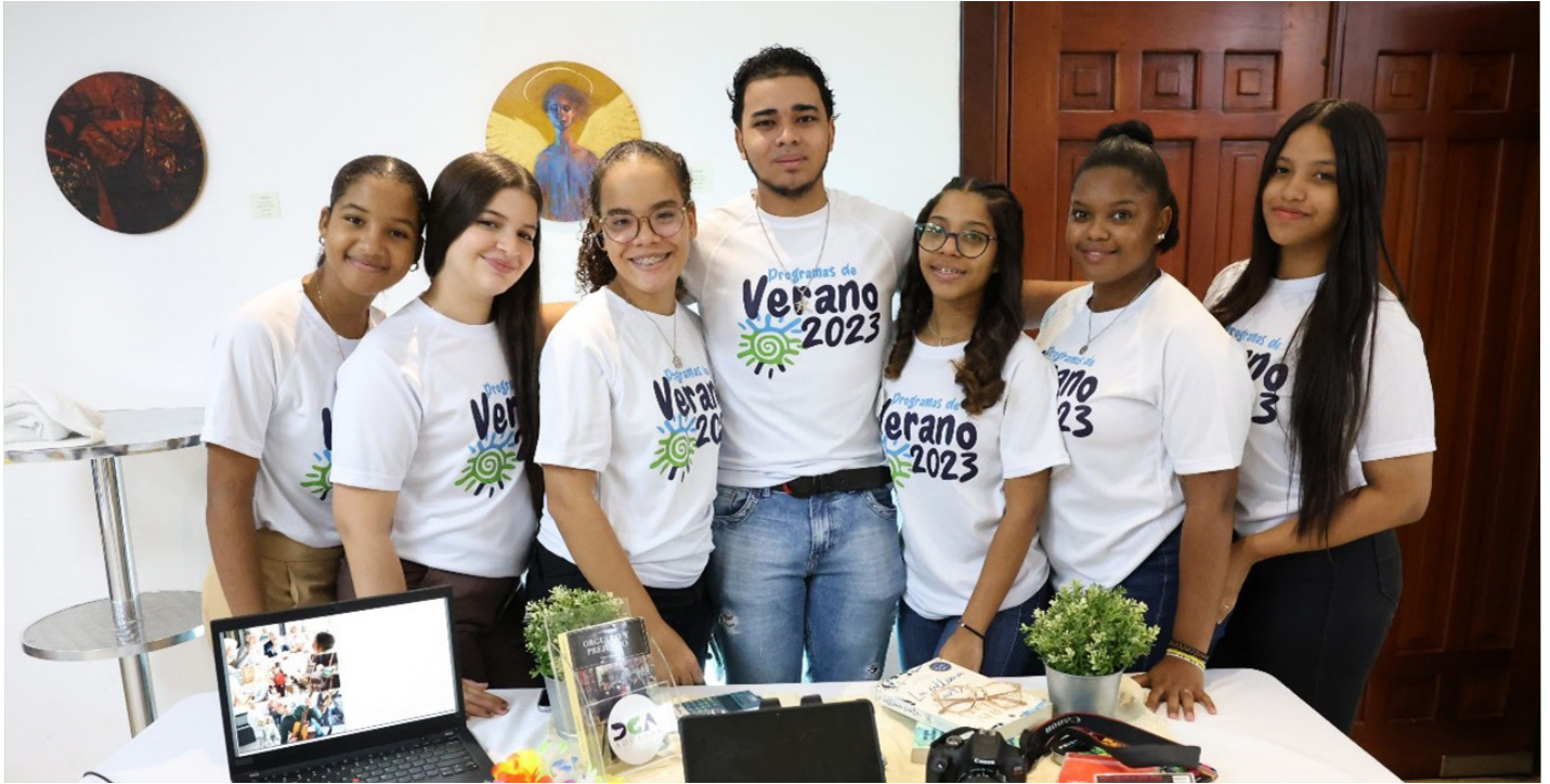
Varios de los estudiantes expusieron sus trabajos de tecnología.