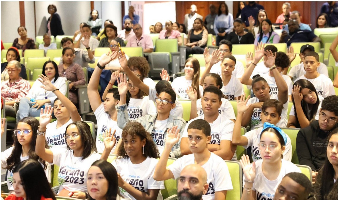
Contento y muy felices, salieron los muchachos que estuvieron en este curso de verano.