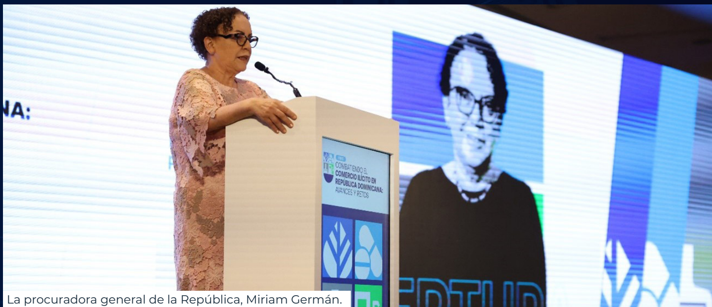
La procuradora general de la República, Miriam Germán.

Este Foro es una expresión de unidad de voluntades del Sector Público y Privado para combatir un problema que afecta de modo significativo a la sociedad y a las estructuras productivas internas. República Dominicana cuenta con la Ley 17-19 que constituye un marco legal que facilita su persecución y erradicación al abordar la cadena de suministro en toda su extensión y al unificar a los más diversos actores que inciden en esta lucha.