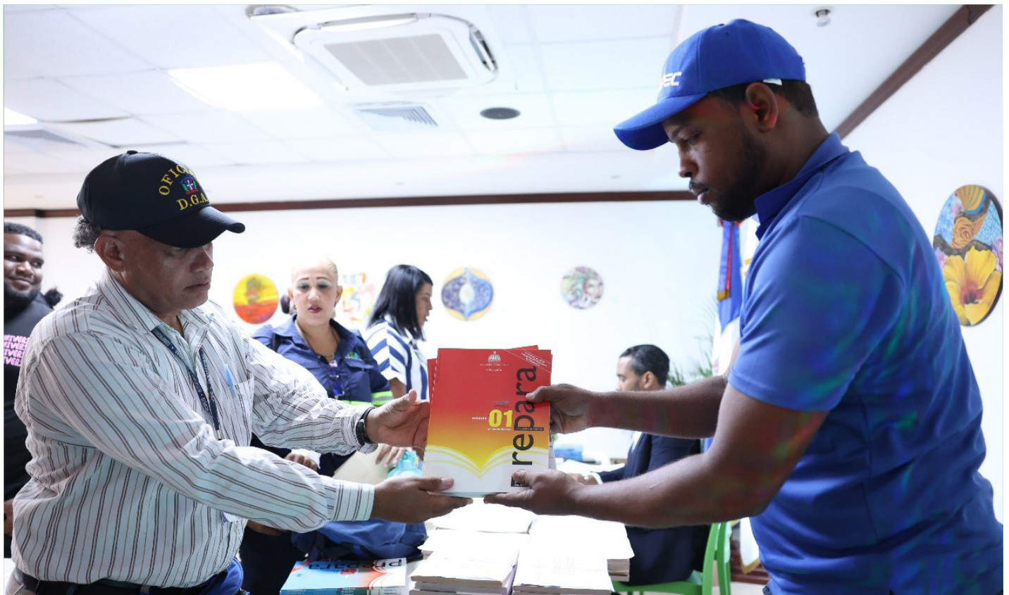
Los colaboradores que decidieron entrar al programa de termino de bachillerato en CENAPEC, recibieron sus útiles escolares.