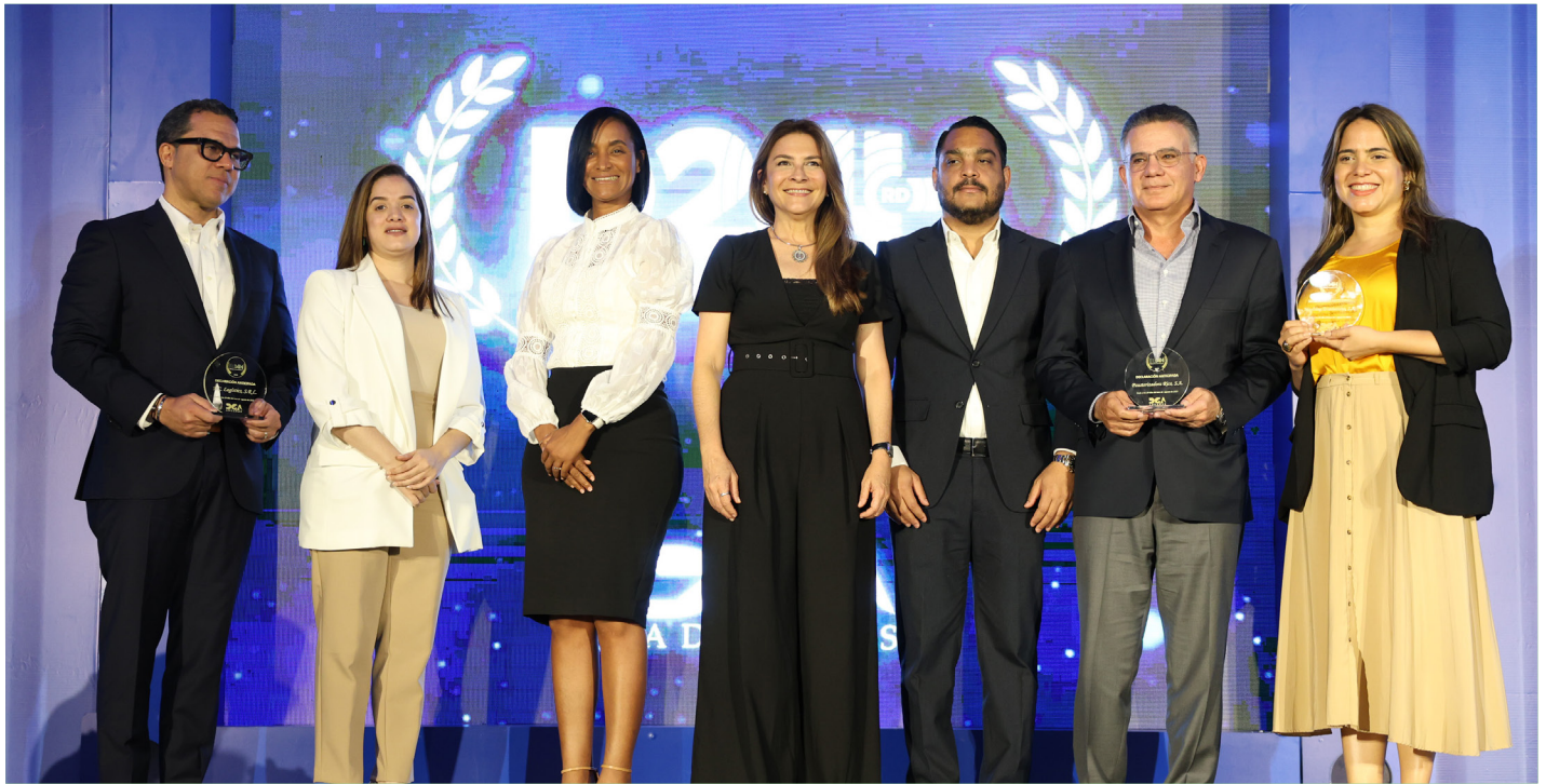
Representantes de las empresas MC. Logística, Pasteurizadora Rica, Marítima Dominicana, Nestlé Dominicana y el Ministerio de Salud Pública, ganadores en los renglones Declaración Anticipada y Eficiencia Vuze.

encargado del proyecto Despacho en 24 Horas, detalló el gran ahorro en tiempo y costos que esta iniciativa ha significado para el empresariado nacional.