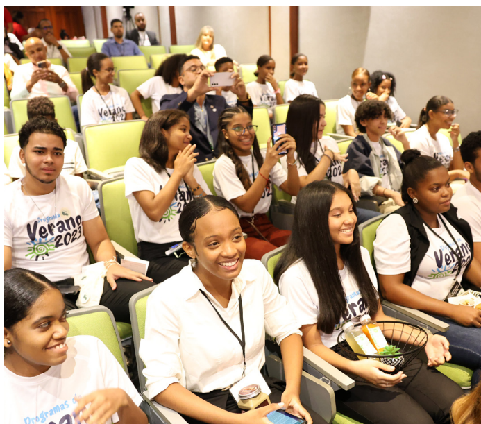
El programa fue clausurado con una feria de negocios, donde los estudiantes presentaron productos.

Así mismo, los jurados determinaron que el grupo más destacado fue Care B&C.