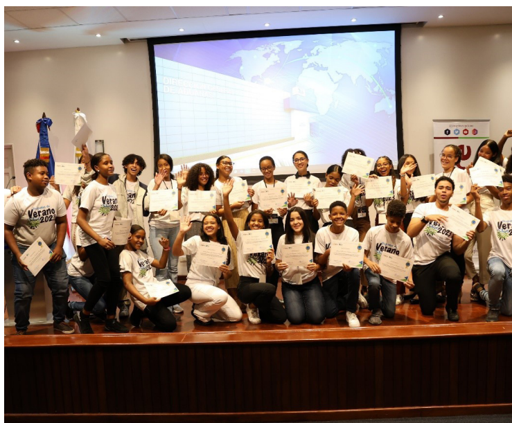
Felices y muy complacidos los jóvenes estuvieron en este primer módulo del “Curso de Verano”, versión Emprendimiento.