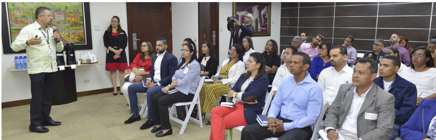
La capacitación se llevó a cabo en la sede central de Aduanas, con la participación de los representantes de 21 empresas Grande Contribuyentes