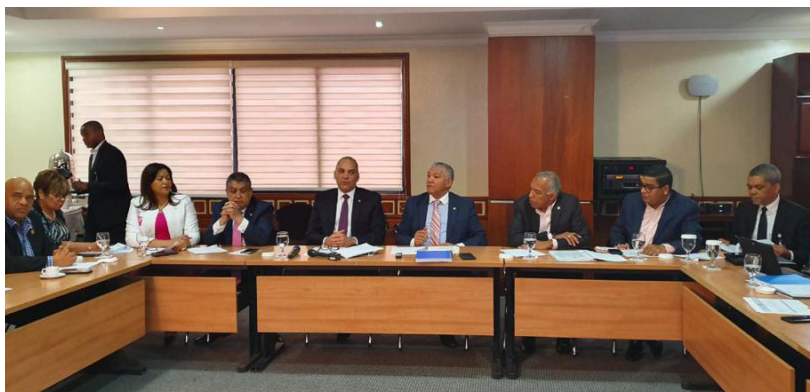
Al centro, el director general de Aduanas junto a funcionarios de la DGA y miembros de la Comisión Especial de la Cámara de Diputados que estudia la Ley de Aduanas.

El proyecto de Ley de Aduanas pretende ajustarse a las demandas globales del comercio de estos tiempos, contemplando aspectos como el acceso a nuevas tecnologías para facilitar los procedimientos aduaneros, el cumplimiento de convenios internacionales y la Estrategia Nacional de Desarrollo.