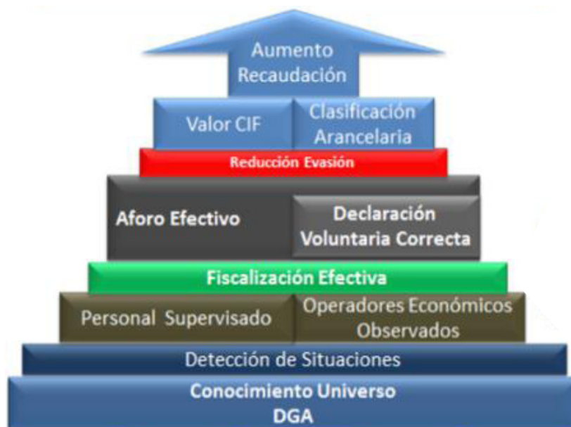
Gráfico No.1 Enfoque Estratégico

El proceso de aduanas es fundamental, procura determinar y cobrar los impuestos en base al valor CIF de las mercancías y la clasificación arancelaria que indica los requisitos, impuestos y tasas a cobrar. La complejidad del proceso aduanero nace con las infracciones, las tentativas de evasión Fiscal y el Contrabando.