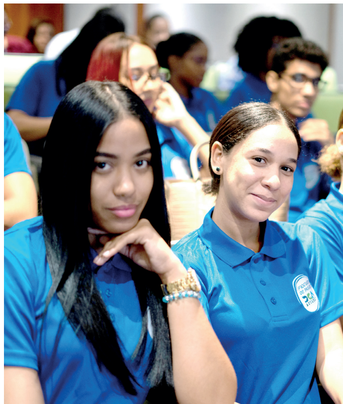
Parte de los nuevos jóvenes que entran a la sexta promoción de "Pasantía DGA". de los nuevos jóvenes que entran a la sexta promoción de "Pasantía DGA".

En el acto estuvieron presente jóvenes de distintas promociones, donde mostraron agradecimiento por lo que le programa generó en sus vidas, pues casi todos están insertos en el mercado laboral.