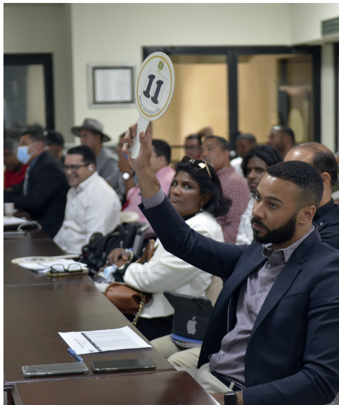
La subasta inicia en la mañana y va pasando a lo largo del día.

Un grupo de colaboradores de la DGA, específicamente de su Departamento de Subastas, compuso el equipo que se encargó de llevar las riendas de dicha actividad. También, estuvieron presentes funcionarios de la Bolsa Agroempresarial Dominicana BARD acompañados de representantes de la notaría pública.