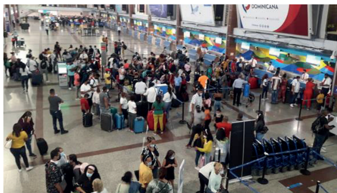
En años atrás, la “Gracia Navideña”, era de un mes.

Para acogerse a esta facilidad, las personas residentes en el exterior, consignatarias de envíos, deberán presentarse a las administraciones aduaneras (colecturías) correspondientes con su pasaporte, facturas de compras, pase de abordar y cualquier otro documento que demuestre que tiene más de seis (6) meses sin ingresar al país. “La medida será aplicada siempre y cuando el ingreso de la mercancía haya sucedido en el periodo establecido para la Gracia Navideña”, especificó la DGA en un comunicado.