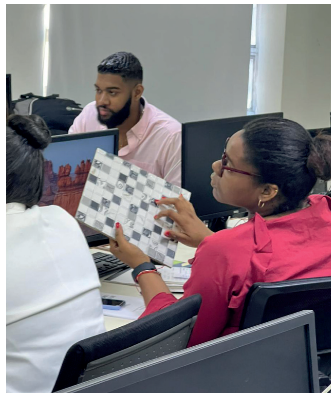
Varios colaboradores tomaron el curso sobre “Unidad de Gestión de Riesgo y Fiscalización”.

Los talleres se expandirán para incluir personal técnico de otras áreas/departamentos.