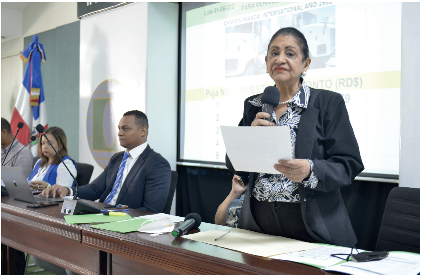
La subasta inicio con el llamado a puja de los artículos que se mostrarón ese día en el espacio preparado para la actividad.